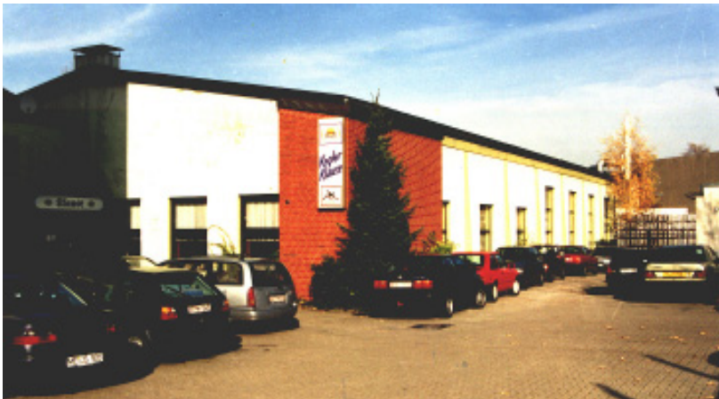
Das Dortmunder Keglerheim mit seiner angegliederten Kegler-Klause

Der Verein hat sich bis heute dem Leistungssport verschrieben. Fast 100 aktive Kegler sorgen in den acht Herren- und zwei Damenmannschaften immer wieder für Furore. Die Herren streben den Wiederaufstieg in die 1. Bundesliga an, die Damen gehören seit langem der höchsten deutschen Klasse an. Besondere Kapitel schrieben in all den Jahren immer wieder die Jugendlichen, deren Erfolge den Dortmunder Kegler-Verein zum erfolgreichsten bundesdeutschen Club in Sachen „Nachwuchsarbeit“ werden ließen.