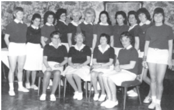
Die Mitglieder des Klubs „Komet“ stellen sich dem Fotografen

In der Disziplin Frauen-Klubmannschaften belegte der Klub „Getreue Nachbarinnen“ des Dortmunder Kegler-Vereins einen achtbaren vierten Platz.